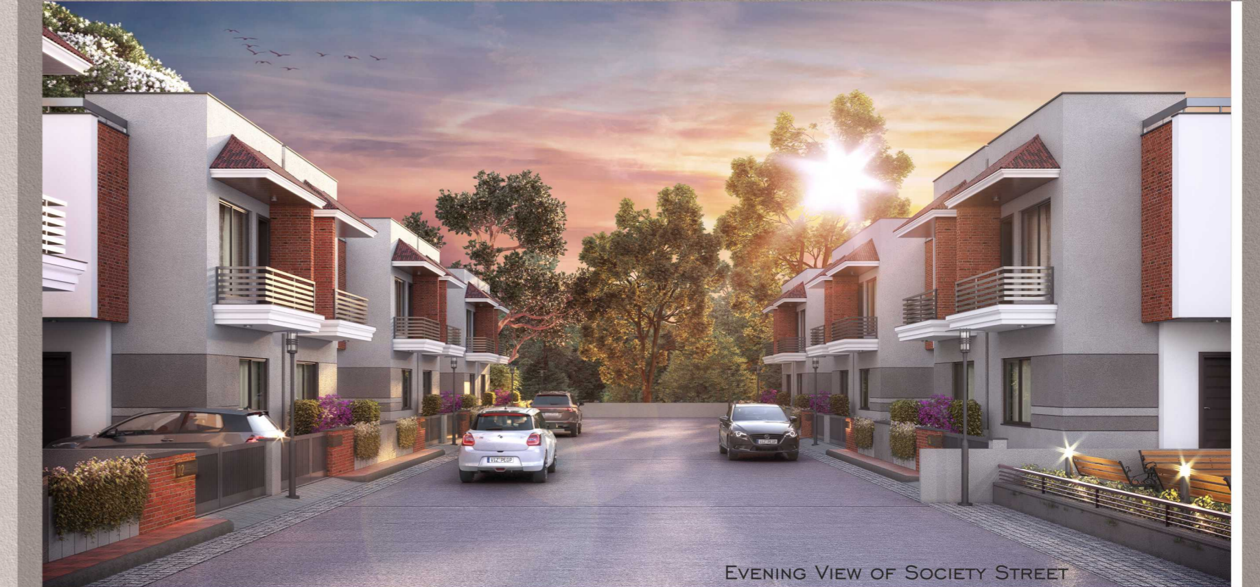
EVENING VIEW OF SOCIETY STREET

બાકરોલ-વડતાલ રોડ પર જોન ગામના બસ સ્ટેશનની પાછળના શાંત વાતાવરણમાં ઉમદા લોકેશન, પ્રદુષણ રહિત માહોલ, મજબુત બાંધકામ, તદ્દન વ્યાજબી કિંમત અને ગ્રાહકોનો અતૂટ વિશ્વાસ થકી અમે રધુકુલ બિલ્ડર્સ રધુકુલ ધરા-૧, રધુકુલ ધરા-૨, અને રધુકુલ ધરા-૩ પ્રોજેક્ટ્સને સફળતાપૂર્વક આગળ ધપાવી રહ્યા છે. સાથે-સાથે ગ્રાહકોનો અવિરત માંગને ધ્યાનમાં લઈને અમે ૩ BHK બંગ્લોઝનો નવો પ્રોજેક્ટ લઈને આપના વિશ્વાસને જીતવાની પ્રતિબદ્ધતા સાથે રધુકુલ ધરા-૪ નું નિર્માણ કરી રહ્યા છીએ.