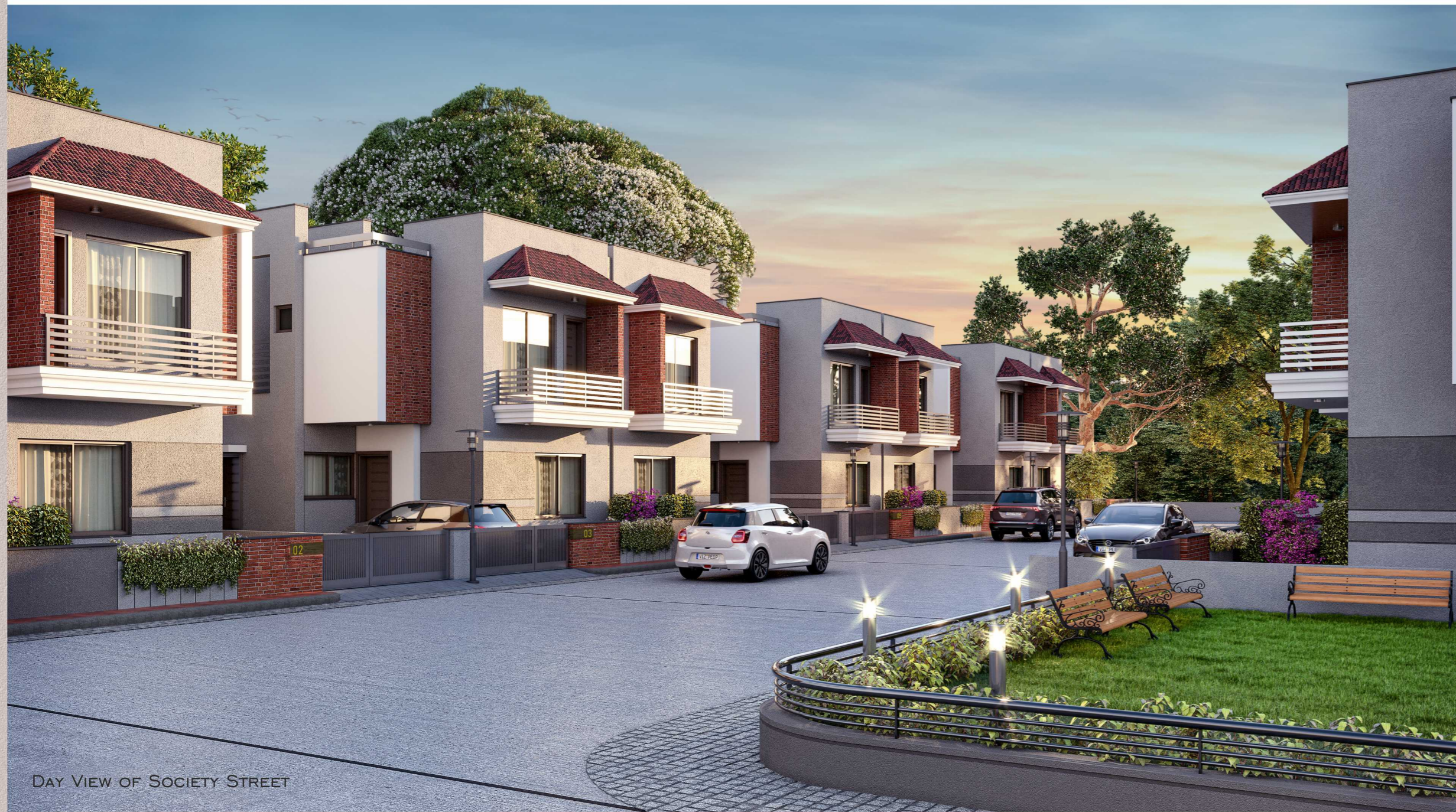
DAY VIEW OF SOCIETY STREET