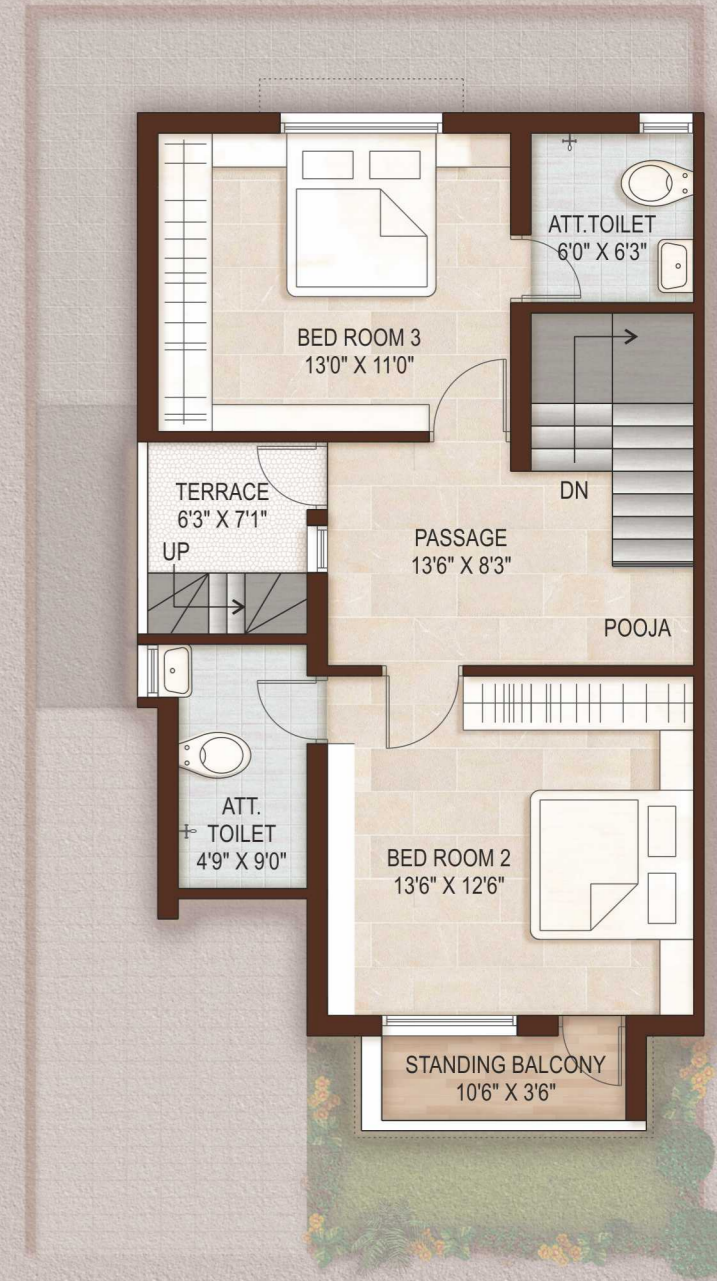
FIRST FLOOR PLAN

रघुकुल ध्वज-4 Luxurious Lifestyle 3 BHK Homes